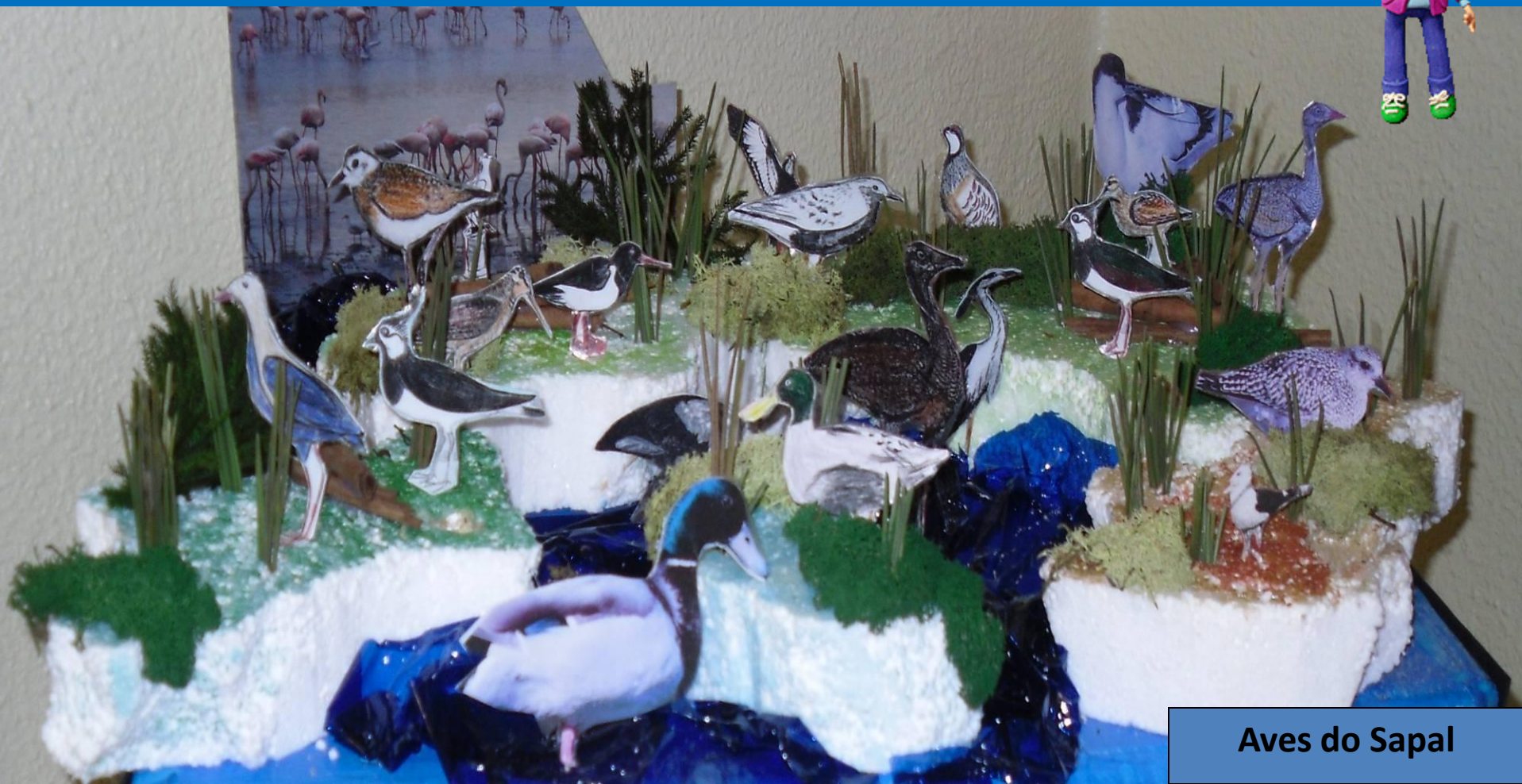
Aves do Sapal